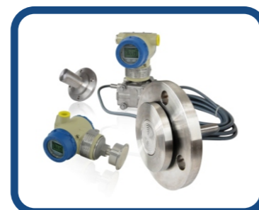
直裝式 / 遠傳式隔離膜片 ADP-D