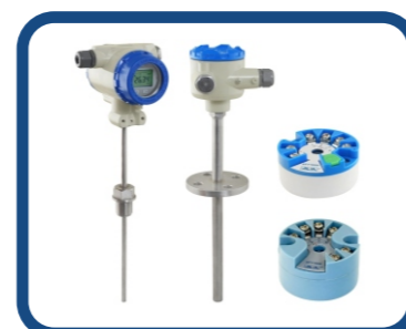
智慧型溫度傳送器 ATT1000