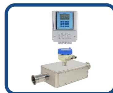
衛生型超音波流量計 AUF770