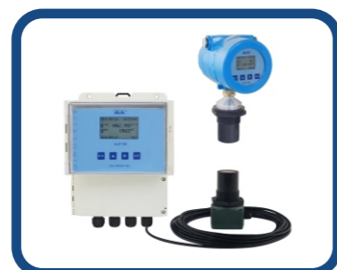
超音波明渠流量計 AUF790