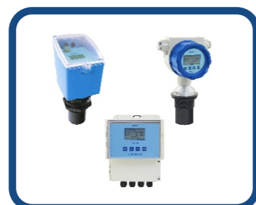
超音波液位傳送器 AUL730